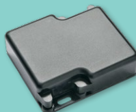
Lommy Rapid L