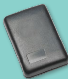
Lommy Rapid S