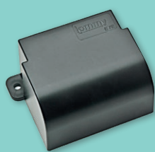
Lommy Eye XL