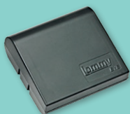
Lommy Eye M